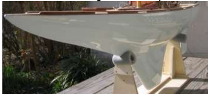
Nun der fertig lackierte Rumpf

Die Lackierung durch einen Profi ist einfach traumhaft schön geworden. Aus Spraydosen oder Pinseln kann man nie diese hohe Qualität erreichen.