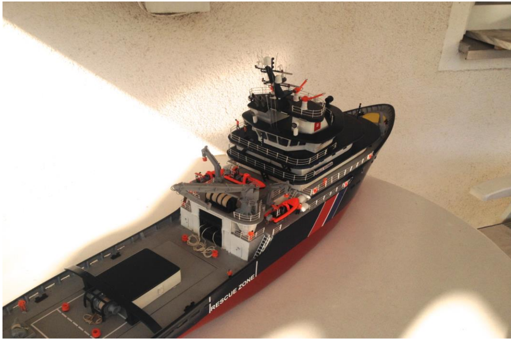
Der fertige Hochseeschlepper AUBEILLE BOURBON